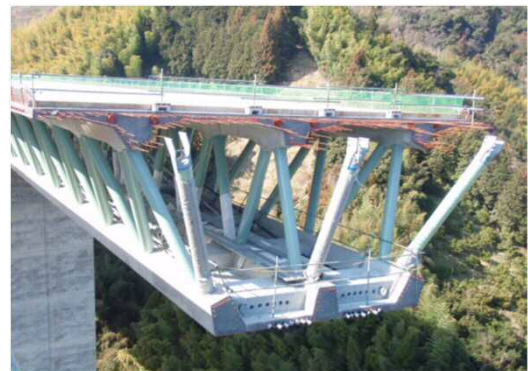
施工段階の主桁断面