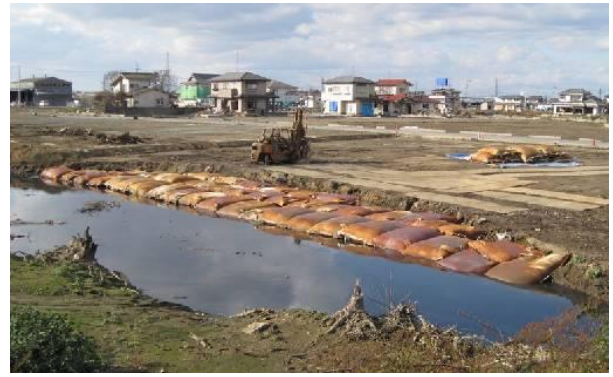
写真-2 河川崩壊箇所復旧状況

エコチューブ工法の特徴としてジオテキスタイル製の袋体に包まれているため、有効利用として積み上げた泥土は水による再泥化が起きない。また処理土の土質区分は、脱水 20 日後のコーン貫入抵抗で 681kN/m 2 を示し、第 3 種改良土になることを確認した。よって震災復興においては河川崩壊箇所 (写真-2)、河口付近被災地域、浸水・冠水箇所への盛土材、埋土材として有効利用することができ、早期の復旧を可能とした。