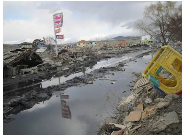
写真-1 東日本大震災直後の状況 (石巻市)