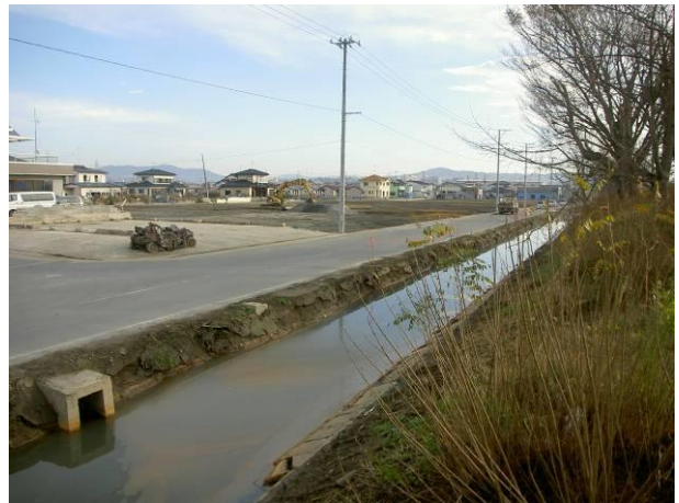
写真-3 工事完了状況

エコチューブ工法は、狭小地での用水路やため池など、生活環境に密着している箇所において簡易に施工可能であり、津波による堆積泥土処理に有効な施工技術である。工事完了後は写真-3 に示すようにきれいな水路が戻り、地元からも大変喜ばれている。今後もエコチューブ工法を用いることによって、震災からの社会基盤の復興に貢献できることを願っている。