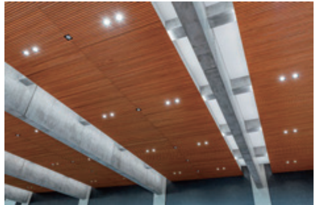
写真-2 PCaPC 梁