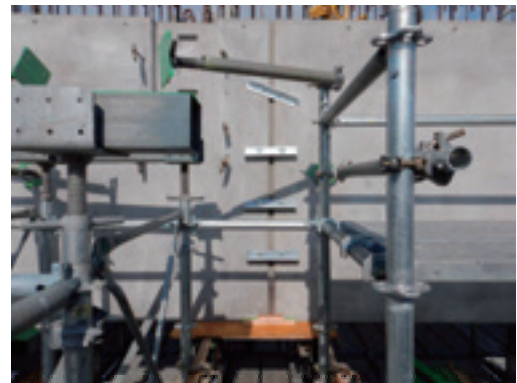
写真-3 大梁分割目地部施工状況

大梁部材は、1階から組み上げられた支保工に架設した。精度管理はレベルにて高さを、トランシットにて平面位置と傾きを測定し、支保工のジャッキで調整を行った。大梁部材は2～3部材を圧着接合するPCaPC梁であるが、梁せいが高く、架設後からPC圧着まで期間が空くことから、振動などによる部材の動きや目地の肌わかれ、転倒などが懸念された。そこで、目地部分で鋼製アングルを用いて部材同士を固定した。また、梁側面をジャッキベースで挟み込み、固定することで転倒防止を行った(写真-3)。これらの対策により、架設後・目地打設後に部材が動くことなく、高い精度の施工を可能とした。