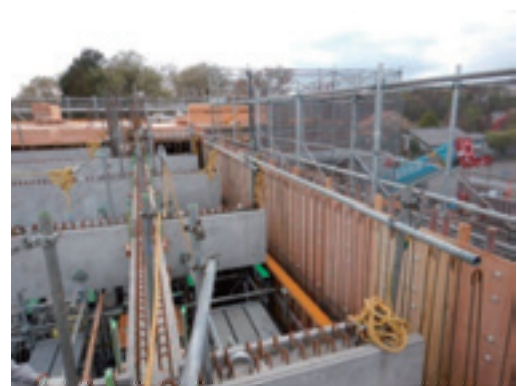
写真-4 小梁端部施工状況

小梁部材の架設も大梁と同様な架設方法で精度管理を行い、水平位置については、大梁部材の欠き込みと目地幅にて測定した。また梁片端が在来部分に架設される小梁部材については、在来部分のコンクリートが打設されるまで動くことが懸念された。そこで、小梁同士・大梁と小梁を単管で繋ぎ固定した(写真-4)。