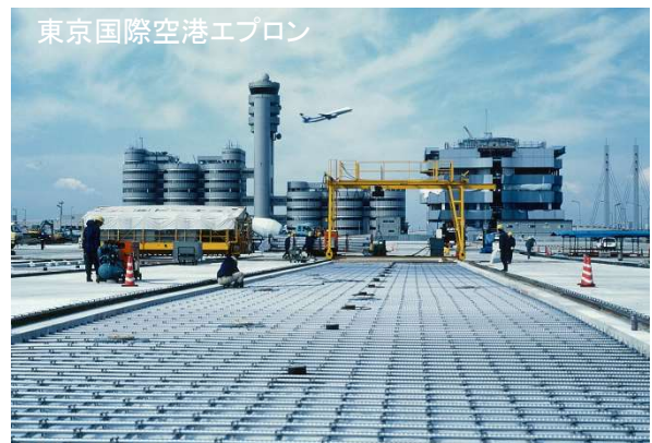
東京国際空港エプロン