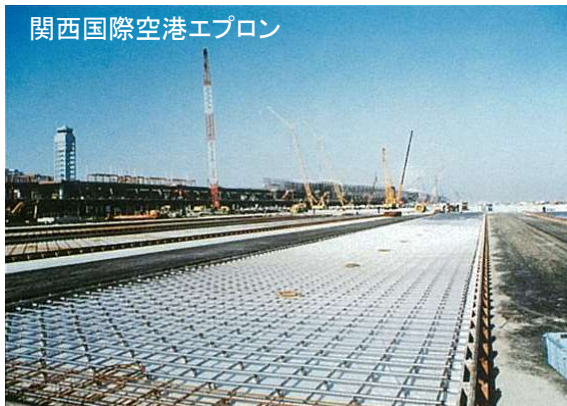
関西国際空港エプロン

荷物や乗客が乗降する空港エプロン部、港湾におけるコンテナヤードやトランスファークレーン走行部などの厳しい荷重条件箇所に適用されています。