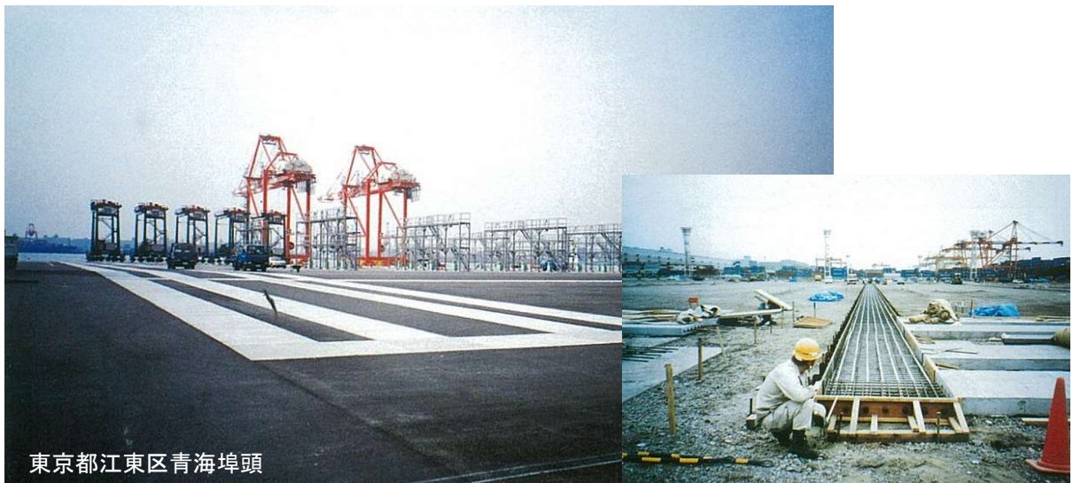
東京都江東区青海埠頭