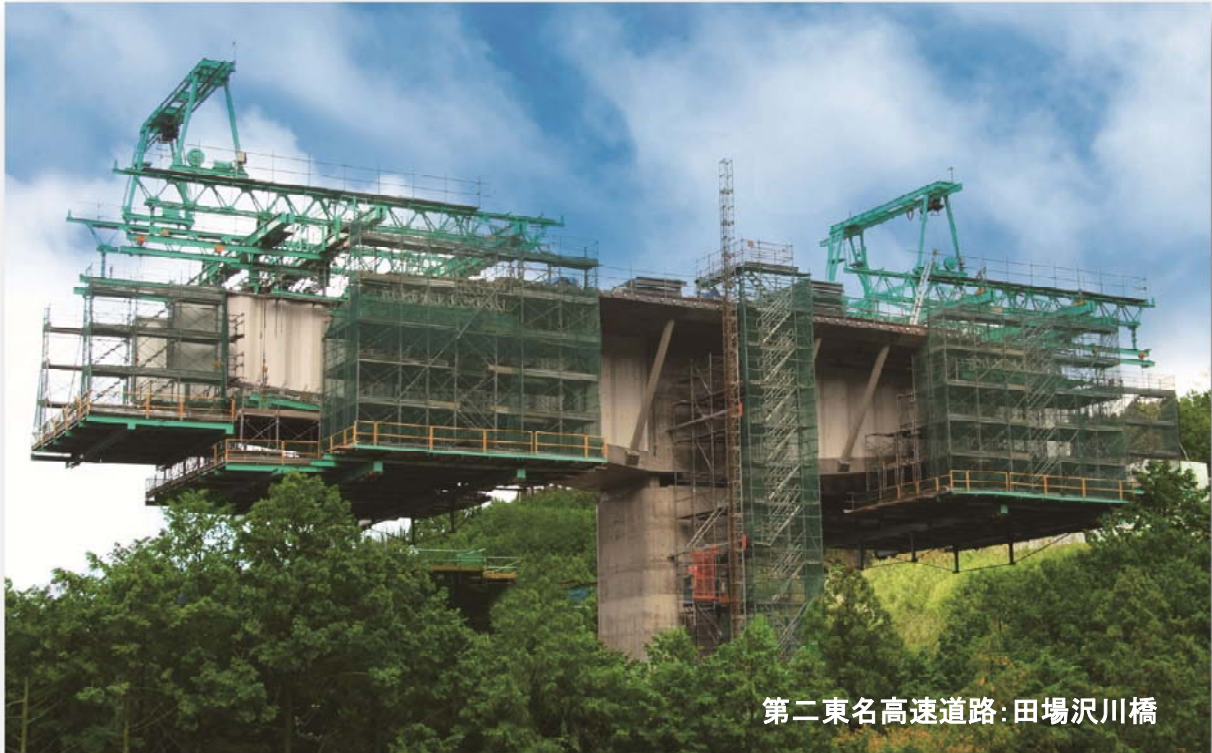
第二東名高速道路: 田場沢川橋

本架設工法は、張出し架設において架設時荷重の一部を波形鋼板ウエブに負担させることにより、施工の合理化を図る新しい架設工法です。具体的には、波形鋼板ウエブに上下フランジを設け、これを連続化・高剛性化することで、波形鋼板ウエブに曲げ耐荷力を付与し、架設時の荷重の一部を負担させます。波形鋼板ウエブが荷重の一部を負担することで、架設機の小型化、施工荷重低減によるPC鋼材量の低減が可能となります。