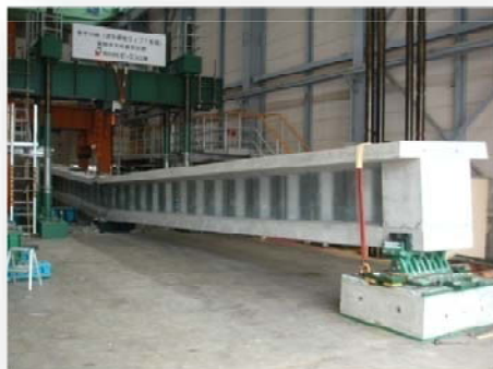
試験後の主桁供試体