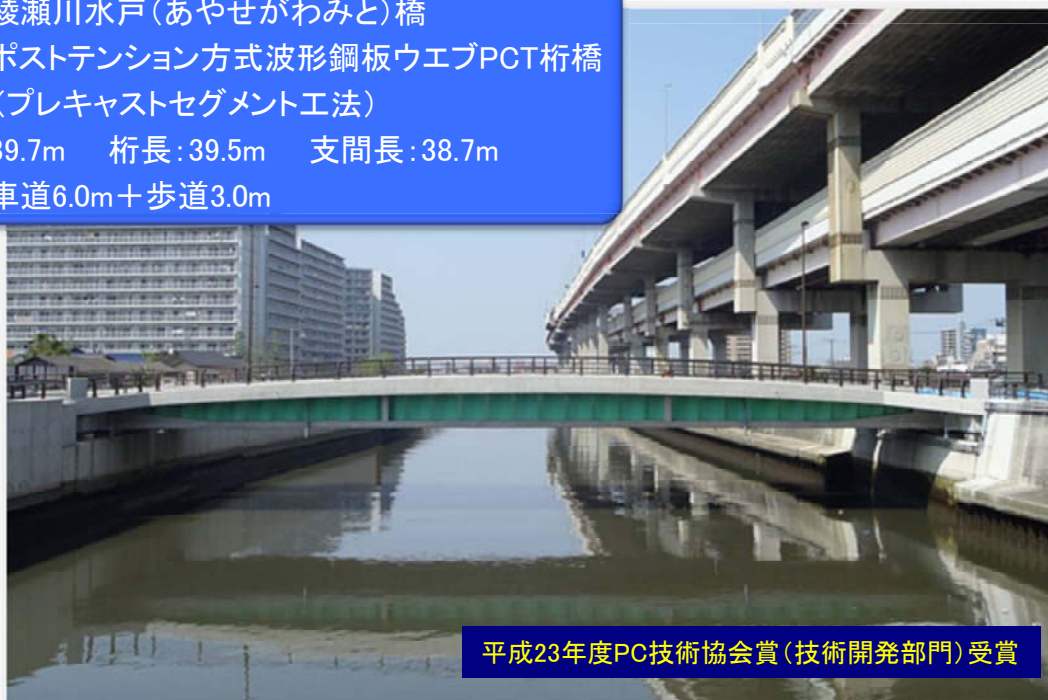
平成23年度PC技術協会賞(技術開発部門)受賞

橋名:綾瀬川水戸(あやせがわみと)橋 橋種:ポストテンション方式波形鋼板ウエブPCT桁橋 (プレキャストセグメント工法) 橋長:39.7m 桁長:39.5m 支間長:38.7m 幅員:車道6.0m+歩道3.0m