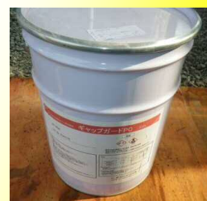
缶タイプ NET 20kg (最少販売単位:1缶)