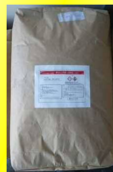
袋タイプ NET 20kg (最少販売単位:20袋)