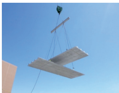
写真-2 床版揚重状況

床版の架設においては、1回の揚重で2枚の版をクロスさせた状態で吊り、揚重回数・時間の短縮を図っている。(写真-2)