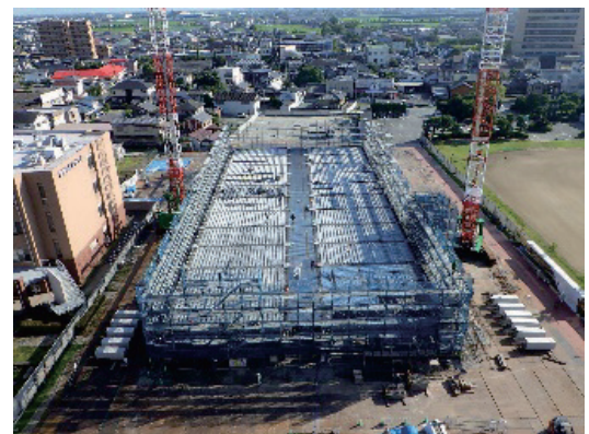
写真-4 施工状況 (サイクル14日目)