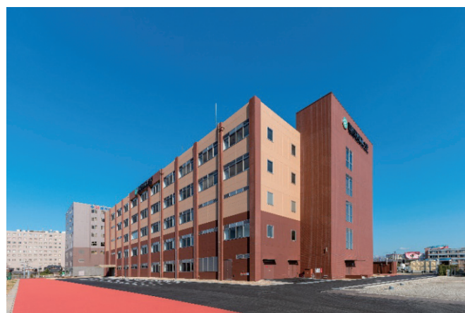
写真-1 新築建物外観

成田の実績を基に短工期を実現するためのサイクル工程を綿密に設定した。地中梁鉄筋の先組工法および「鉄筋じゃばら工法」を実施することで もっとも不確実な基礎工事においてもシステマ的にかつ安全に工事を円滑に進めることができた。以下に施工計画・施工方法について報告する。