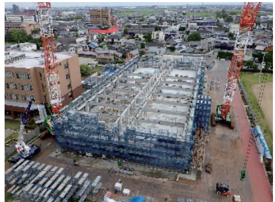
写真-3 施工状況 (サイクル8日目)

また、外部足場や床版支保工を、前途したように南北の地組みエリアであらかじめ組立てておく事により、作業時間を短縮でき、無理のない工程とすることが出来た。