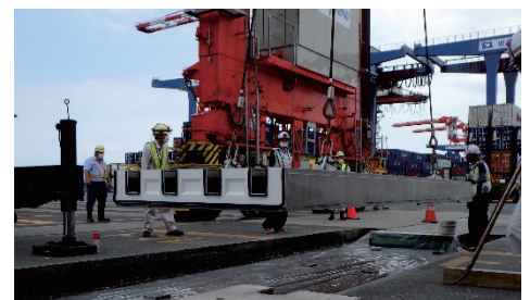
写真-1 施工試験実施状況

Pa : 1 組の継手が伝達する荷重（せん断耐力:kN） λ : 舗装の剛比半径(mm) P'e : 等価単車輪荷重(kN) 0.47 : 荷重伝達能力の係数(荷重伝達率/2)