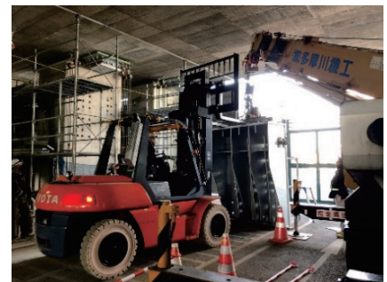
写真-1 ブラケット設置状況

Key Words : 支承, ジャッキアップ, 水平力分担構造, 鋼製ブラケット