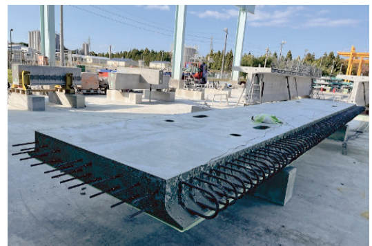
写真-1 プレキャストPC床板試験体