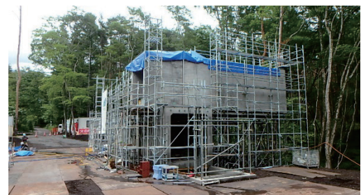
写真-2 PCa ボックス建逃げ架設状況

本工事において問題となったのは、現場までの道路幅が狭い（最狭約2.2m）山道のため通行できる重機や車両に制限があり、揚重機は60tラフター、車両は大型増トン車が最大であった。また、敷地の高低差が激しく揚重機や車両の配置計画が制限されていた。そこで、4列のPCaボックスの内、2列を建逃げて施工することで施工の効率化を図った。また、施工途中のPCaボックスは、1段目は基礎梁上、2段目は支保工上に乗った状態であり、PC緊張までに地震や重機走行時の振動でPCaボックスが動くことも想定されたため、PCaボックスの上下に配置した各7ケーブルのPC鋼より線21.8mmのうち、各2ケーブルをPC鋼棒（呼径26mm）に変更し、途中でPC鋼棒を緊張しながら部材架設を行うことで施工精度を高めた。