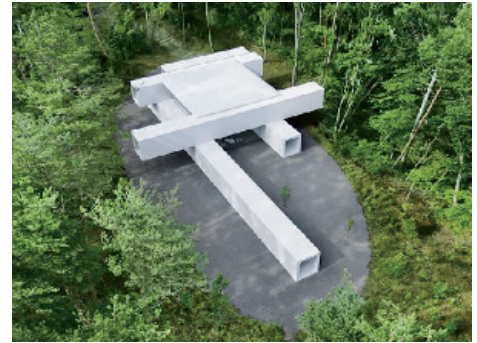
写真-1 建物外観 (有限会社 nendo 様より受領)

シンプルな形状で建物を構成する四角い筒状の構造体は、全てが同断面の形状であり、プレキャスト化するのに適していた。ロの字型のプレキャスト部材として分割する計画とし、1列に敷き並べたPCa部材をPC鋼より線を用いて圧着接合するPCaPC工法とすることを提案した。その合理性と施工性の高さが評価され、本建物のコンセプトの一つとして採用された。