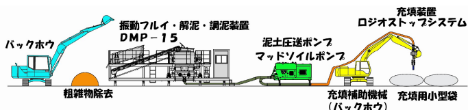
図-1 SPAD システム概念図

SPAD システムの特徴は概念図（図-1）の様に①振動フルイ・解泥・含水比調整装置、②マッドソイルポンプ、③充填装置を装備しシステム化したものである。