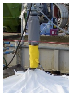
写真-4 逆流防止エアー バック