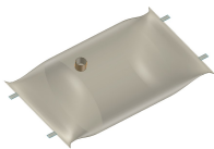
図-2 袋体 (1.0m 3 用)