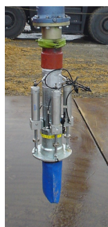
写真-3 エアーシリンダー式 充填装置