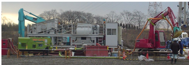
写真-5 SPAD システム全景

施工サイクルタイムを計測した結果は、1袋(1.3m 3 )当たり3分10秒である。これにより、日施工量は120袋である。