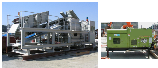
写真-1 振動フルイ・解泥 写真-2 マッドソイルポンプ ・含水比調整装置

ポリエステル製のポンプ充填用袋体（図-2）である。今回の小型袋体は規格が1.0m 3 対応であるが、最大容量1.3m 3 充填することが可能である。この袋体の諸性能を表-1に示す。