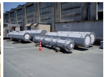
写真-5 完成したセグメント