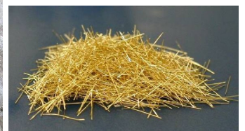
写真-3 スチールファイバー