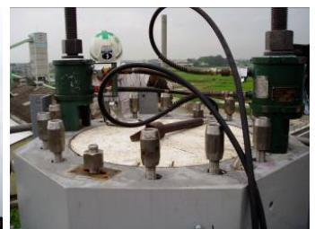
写真-7 PC鋼棒の緊張状況