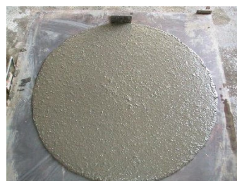
写真-2 ダックスモルタル