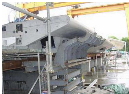
コンクリート桁の製作 (ロングラインマッチキャスト方式)