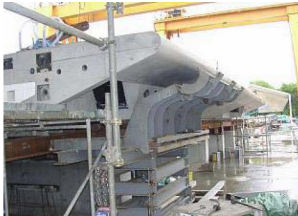
コンクリート桁の製作 (ロングラインマッチキャスト方式)