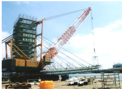
コンクリート桁の架設